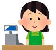
セブン-イレブン 各店舗

【利用が難しい場合】 申し訳ございません。 駐車場に余裕が無いため、 ご遠慮願います。